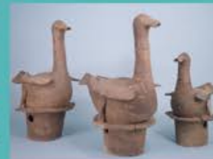
津堂城山古墳出土 水鳥形埴輪 (重要文化財)