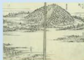
「河内名所図会」の応神天皇陵古墳のさし絵

江戸時代には「河内名所図会」という今でいうガイドブックのような書物がありました。そこで応神天皇陵古墳が紹介されています。古墳の上には応神天皇をまつる六角堂があり、そこへ至る桜並木とともに描かれています。