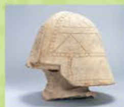
いたすけ古墳出土 青形埴輪