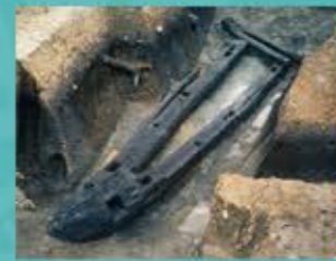
修羅(重要文化財) 重い荷物を載せて運ぶソリのような道具

八島塚古墳と中山塚古墳の間の濠の発掘調査では大小二つの木製の修羅が見つかりました。