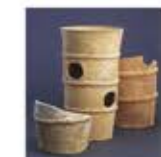
제니즈카 고분 출토 원통 토용

A4 현재는 숲이 무성하지만 축조 당시에는 나무가 없었습니다. 분구의 경사면에는 돌이 깔려 있었습니다. 이것은 '후키이시(=점석)'이라 부릅니다. 분구의 평탄한 곳에는 수많은 토용이 배열되어 있었습니다. 고분은 성대하게 장식되어 있었습니다.