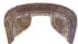
콘다마루야마 고분 출토 안장식장식 (국보 콘다히지마구 신사 소장)

A1 원과 사각을 연결한 형태로 위에서 보면 열쇠 구멍처럼 보이는 고분입니다. 대표적인 고분으로는 일본 최대 면적인 닌토쿠전황릉 고분과 일본 최대의 체적인 오진전황릉 고분이 있습니다. 대부분의 거대 고분이 전방후원분으로 고분 시대 초기부터 말기 무렵까지 지속적으로 축조되었습니다. 야마토 왕권의 왕을 비롯해 유력자가 이 형태의 고분을 축조했습니다. 일본 독자적인 형태로 이 형태의 의미에 관해서는 여러가지 가설이 존재합니다.