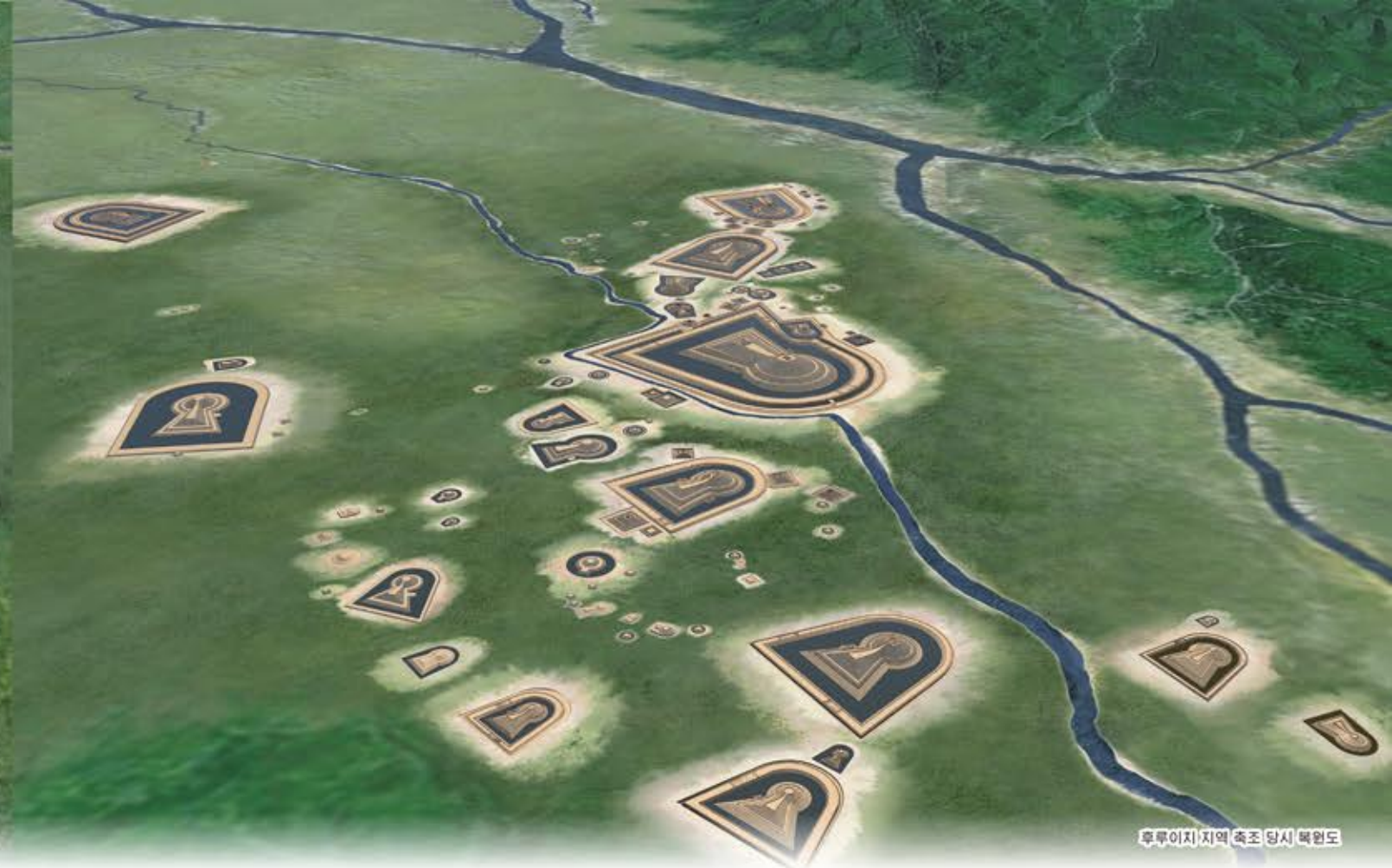
후루이치지역 축조 당시 복원도