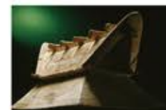
구리즈카 고분 출토 집모양 토용