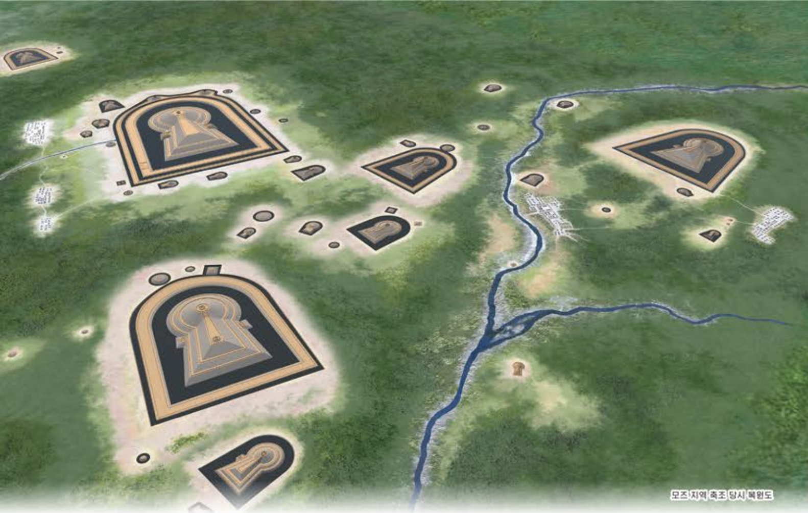
모즈지역 축조 당시 복원도