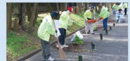
닌토쿠릉 수호대가 펼치는 청소활동

모즈·후루이치 고분군에서는 지역 주민들이 봉사활동으로 고분과 그 주변의 청소활동을 실시하고 있습니다. 가깝고 소중한 고분을 아름다운 상태로 다음 세대에 물려주고자 하는 정성이 느껴집니다.