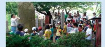
후루이치 고분군 탐험프로젝트

옛날 사람들은 분구를 사토야마(=생활과 밀접한 야산)로 이용하거나 해자의 물을 논에 대거나 하면서 오랫동안 고분과 함께 살아왔습니다. 고대로부터 유구한 역사 속에서 사람들의 생활과 공존 해 온 고분을 체험하면서 아이들이 그 가치를 배우고 있습니다.