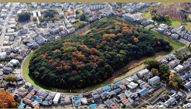
No.26 나카쓰키히메노미코토릉 고분