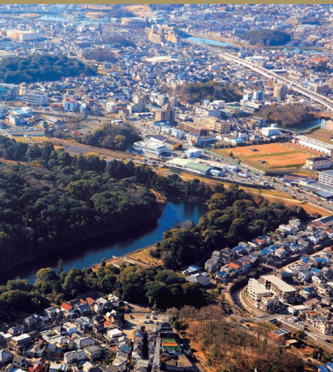
No.33-1 오진노자키 고분

고분이 활발하게 축조된 이 시대는 '고훈시대'라고 불리고 이 시대 이후 일본 열도에서 고대 왕권이 형성되어 갔습니다.