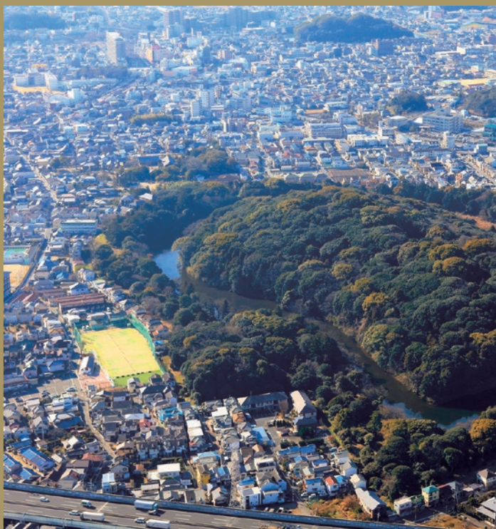
No.21 니시자키 고분